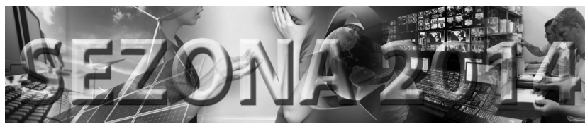
Hotel Hyatt Regency, 19. februar 2014. godine